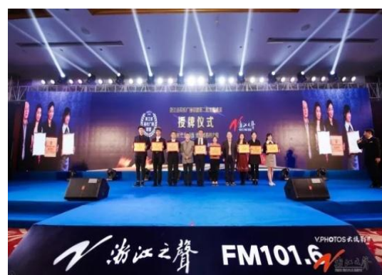
第二批广播高校联盟成员合影

浙江省高校广播联盟定期组织联盟院校广播台主持人培训，选拔优秀校园主持人到浙江广播电视集团实习，并且将联合举办首届“声动浙江”全省大学生艺术节、“校园文化”挑战赛等活动。挖掘高校好声音，打造未来星主播。《浙广早新闻》、《浙江新闻联播》在联盟院校广播站将同步播出。