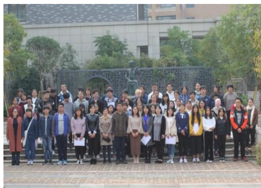
与会领导与全体代表合影

生之间沟通桥梁的作用。在校党委和校团委的领导下，团学干部要互相协助、相互配合，将系部团学工作做得更加出色，使团学组织成为加强学生思想政治教育及日常管理的中坚力量，推进校园文化建设的重要载体，提升大学生综合素质的主要平台。