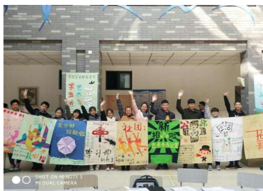
艺术系第一届学生会招新工作圆满完成

据悉此次学生会宣传海报从整体设计，到绘制、上色均由艺术系学生会宣传部成员制作。现场主席团及各个部门的部长、副部长在全面介绍各部门职能，讲解部门特色的同时，耐心、详尽地解答每一位应聘学生的提问，得到了 2017 级新生的认可和支持。同学们纷纷表示愿意加入到学生会这个温暖大家庭中，通过学生会这一优秀的平台来进一步锻炼自我、展示自我，也希望能够在这个平台中结识更多的同学，互帮互助，为我们共同的大家庭贡献自己的一份力量。