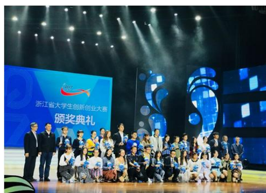
参加决赛的选手合影

浙江省大学生职业生涯规划与创业大赛以“创新放飞梦想、创业成就人生”为主题，旨在充分发挥“以赛促学、以赛促教”的积极作用，引导各高校主动服务创新驱动发展战略，积极创新人才培养模式，普及大学生职业生涯规划意识，提高大学生的创新精神、创业意识和创新创业能力，深化大学生创业实践，从而进一步推动我省加快实施创新驱动发展战略，努力造就“大众创业、万众创新”的生力军。