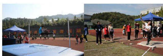
奋力拼搏，彰显特教学子风采