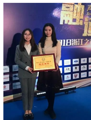
学生代表参加联盟授牌仪式