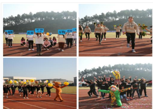
开幕式上各班风采

开幕式上各班级代表队展示精心准备的道具和创意动作，昂首阔步、精神饱满，有的还高呼着响亮的口号走过主席台，展示了我校学生健康阳光、积极进取的精神风貌。