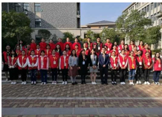
教师代表与全体志愿者合影

在校园的每个角落，你都能看见身穿红马甲的志愿者，她们秉承着优良的服务精神，饱含热情，积极投身到了志愿服务中。他们坚守岗位，从未有过迟到或