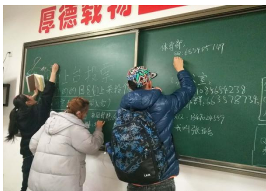
各部门进行招新宣传

为给 2017 级新生提供一个锻炼自我，展示自我，提升自我的平台，同时也为学生会干部队伍输送新鲜血液，确保学生工作可持续的发展。艺术系于 2017 年 11 月 22 日在拱门大厅开展了第一届学生会招新宣传活动，艺术系新生踊跃报名，现场气氛热烈。