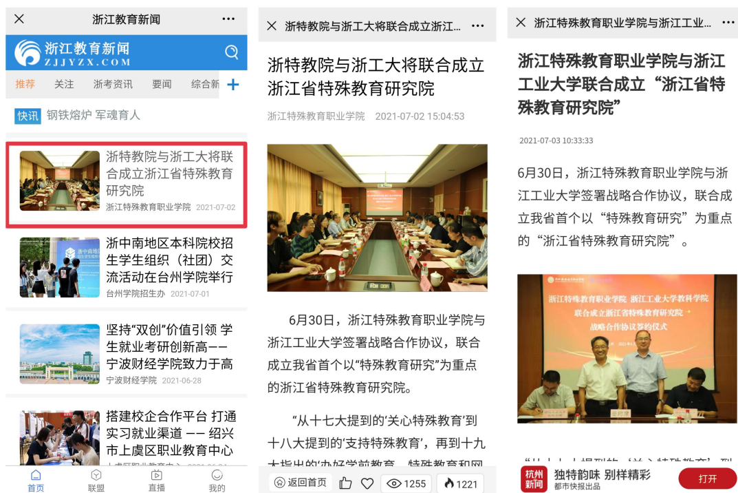
图 16 媒体关注学院成立浙江省特殊教育研究院