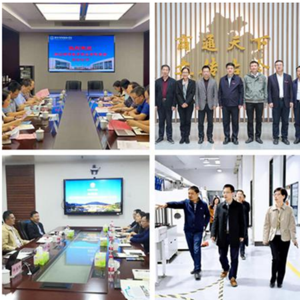
图 15 学院领导赴兄弟院校考察调研

校际联合开展“3+2”人才培养方面。2021年，学院与浙江省盲校、宁波特校等达成校校合作共识，在中西面点工艺、康复治疗技术（推拿）两个试点专业深入对接“3+2”中高职合作，联合创新共育人才，提升盲人就业层次。与浙江科技学院、浙江中医药大学开展专升本衔接，联合本科学士生，搭建人才培养立交桥，打通学生学习上升通道。