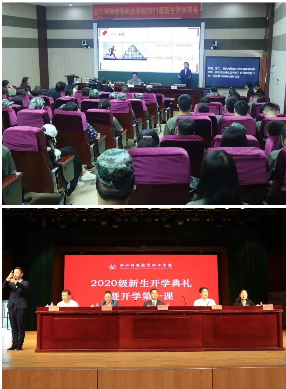
图1 学院开学典礼暨开学第一课