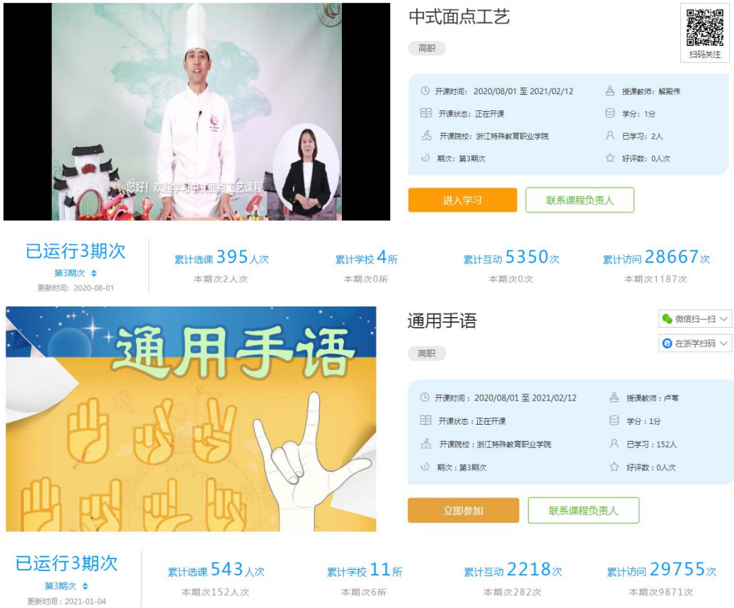
图 11 浙江省精品在线开放课程建设项目

2021 年，学院全面落实《浙江特殊教育职业学院在线开放课程建设应用与管理办法（试行）》，并开展校级精品在线课程建设申报工作，新立项院级精品在线开放课程 6 门。全面落实《校本教材建设管理办法（试行）》，并组织开展 2021 年度新形态教材建设，新立项院级新形态教材 7 部。