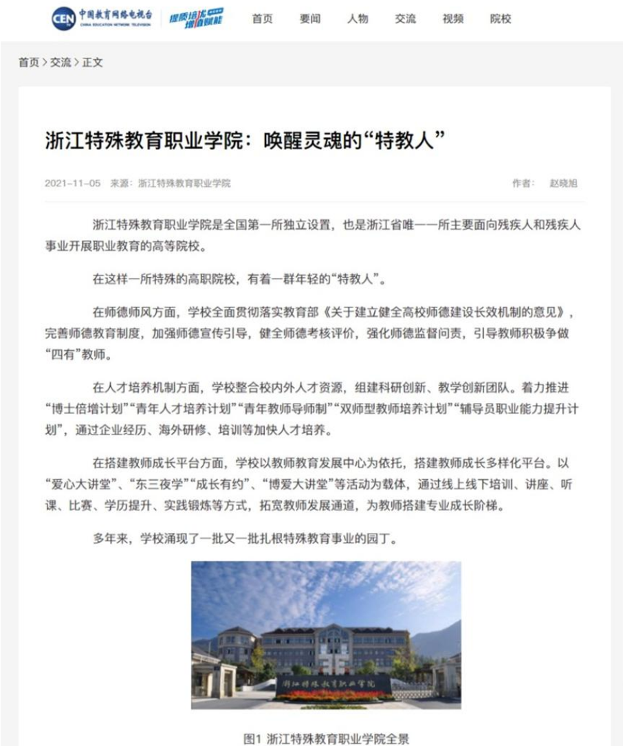
图 14 学院选送的“提质培优、增值赋能”优秀案例在中国教育电视台展示

院：唤醒灵魂的“特教人”》成功入选典型案例，并在中国教育电视台相关平台进入公开展示。近年来，学院持续探索“残健融合 协同共培”的特殊教育类高职院校育人模式，建成了社会适应教学、新业态技能提升、创新创业助力型的国内有影响力的“普特融合”职教师资队伍。十三五期间，20 余名教师获得省级及以上荣誉。学院将以此次入选“提质培优、增值赋能典型案例”为契机，在政校企协作打造卓越特殊教育教师队伍上持续发力，切实有效地推动“双高”建设。