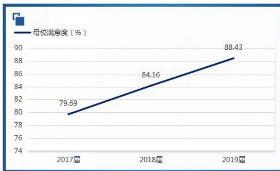
图 9 2017-2019 届学院毕业生对母校的满意度

根据浙江省教育评估院数据显示，学院 2019 届毕业生对母校的总体满意度 88.43%。与前两届相比较，近三年来毕业生对母校的总体满意度呈上升趋势。