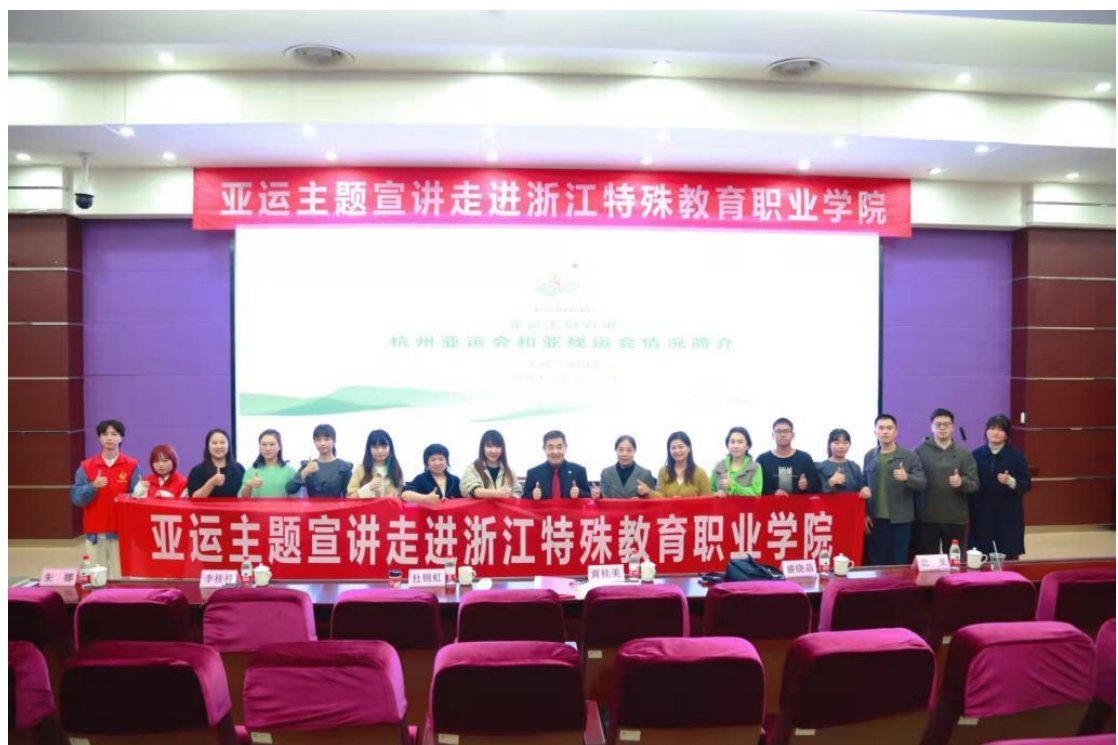
图 18 亚运主题宣讲走进学院

接亚组委，在师生中开展亚运志愿服务宣讲、报名、海选。鼓励师生以饱满热情的姿态迎接亚运，弘扬志愿文明理念，展现新时代特教青年风貌，推动残疾人在更高层次、更广范围参与和融入社会生活，促进社会的和谐、稳定与进步。