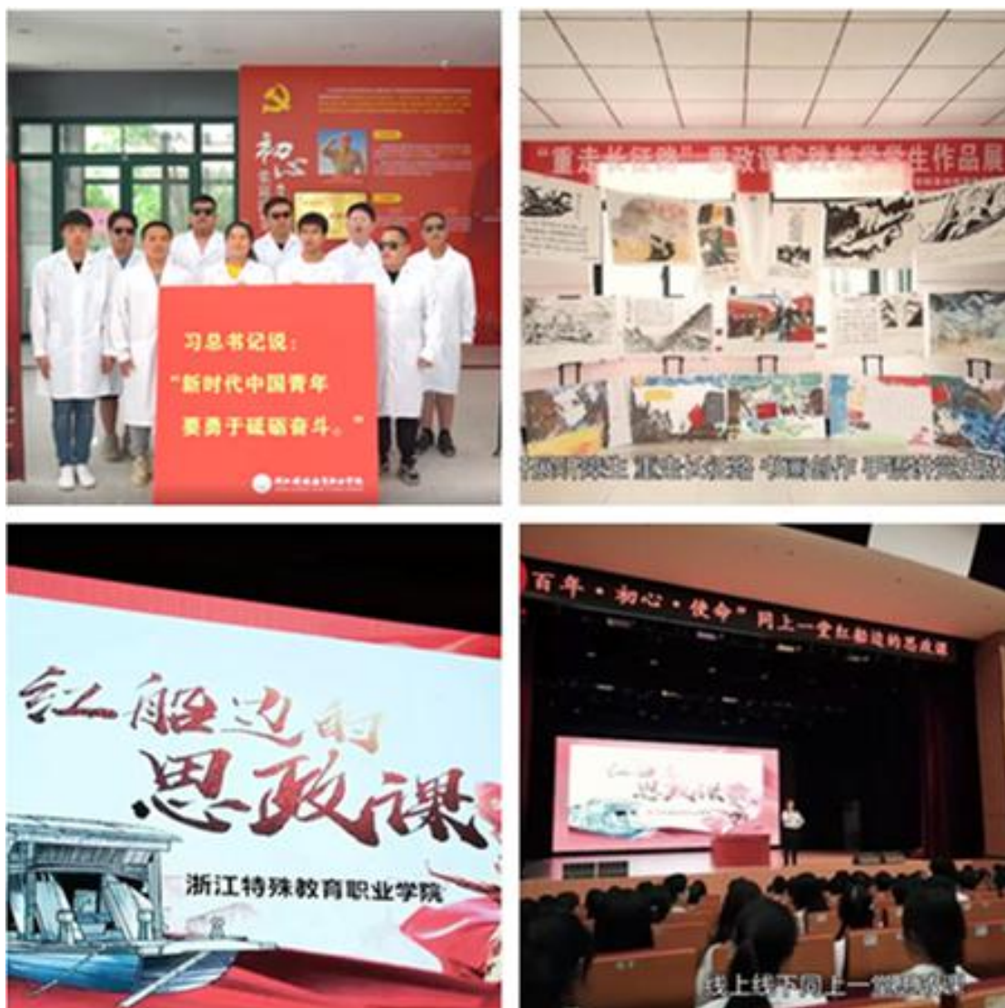
图2 学院“四史教育”实践教学活动中引多家主流媒体关注