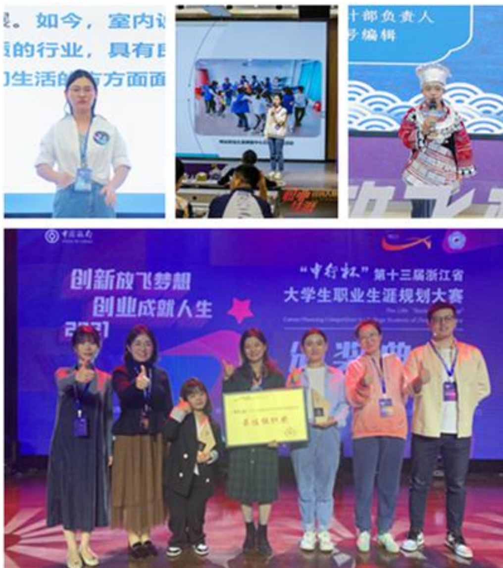
图6 第十三届浙江省大学生职业生涯规划大赛学院获奖学生、教师