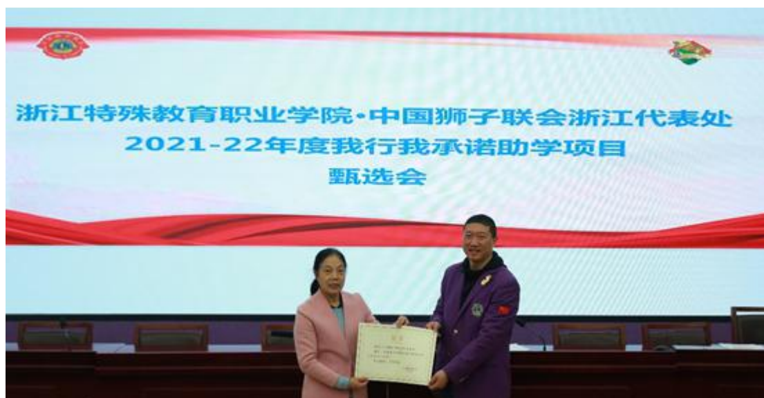
图 5 2021-2022 学年“我行·我承诺”大学生助学项目甄选会

专项补贴方面，为帮助经济困难学子，学院开展“阳光助跑 爱在特教”精准帮扶。本学年累计发放爱心床上用品达 73 人次。临时困难及时解决，学院对于遭受临时突发性事件而导致生活困难的学生，给予临时困难补助，本学年共资助 8 人，合计金额 27000 元，以保证学生正常学习生活。