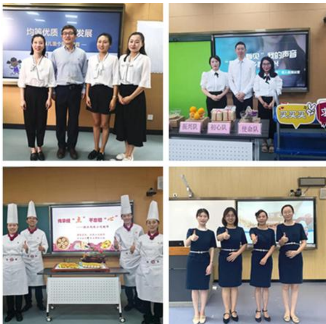
图 13 学院 2021 年浙江省高职院校教学能力比赛参赛队伍