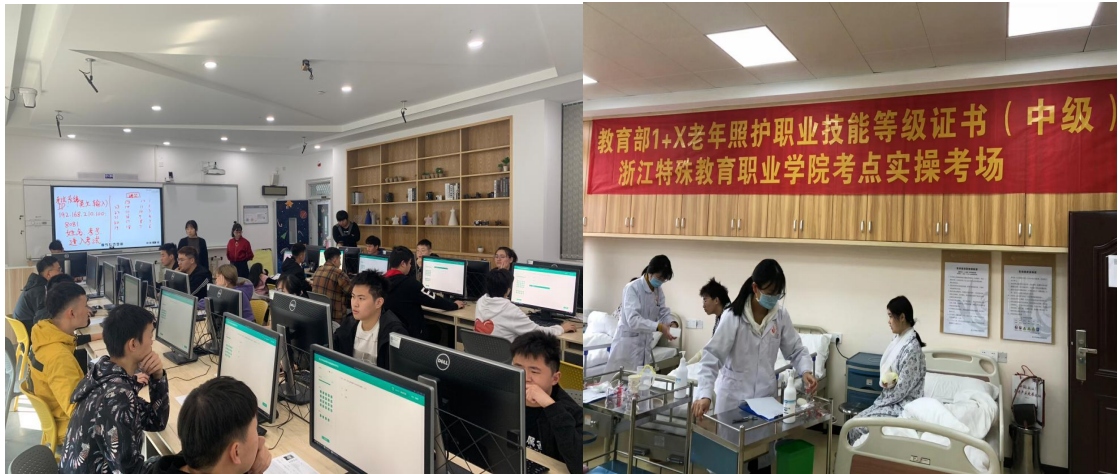
图 10 1+X 证书认证考试现场