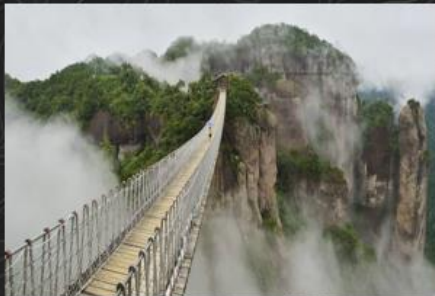
神仙居风景名胜区(国家5A级)