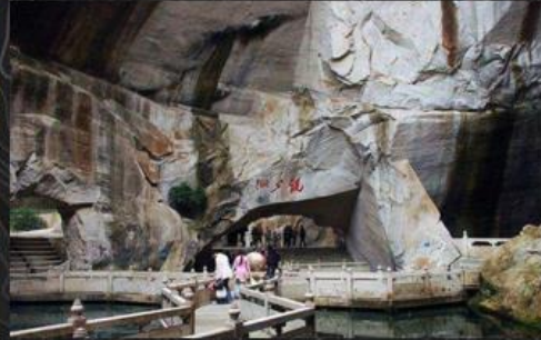
长屿洞天风景区(国家4A级)