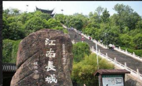
江南长城(台州府城墙)